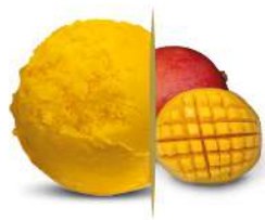
56421 SORBETTO AL MANGO