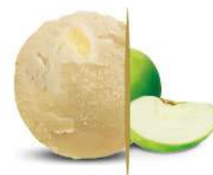
39811 SORBETTO ALLA MELA