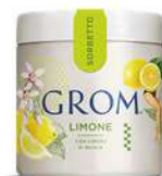
61861 LIMONE Con Limoni di Sicilia