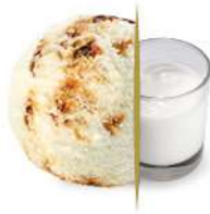
82664 YOGURT GRECO & MIELE € 5,5 lt