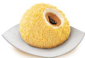
62841 TARTUFO CUOR DI CAFFÈ