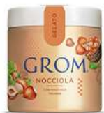
65625 NOCCIOLA Con nocciole italiane