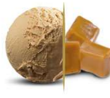
50101 CARAMELLO € 5,5 lt