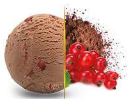
40544 CACAO E FRUTTI ROSSI € 2,4 lt