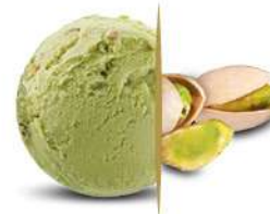
03233 PISTACCHIO € 5 lt