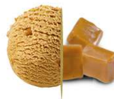
46694 CARAMELLO SALATO € 2,4 lt