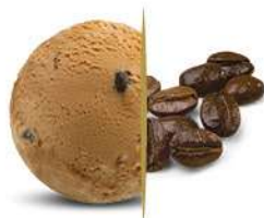
46762 CAFFÈ € 5 lt