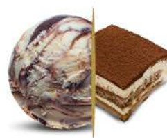
03223 TIRAMISÙ € 5 lt