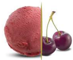
96176 AMARENA € 5 lt