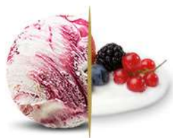
50107 YOGURT E FRUTTI DI BOSCO € 5,5 lt