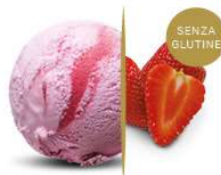
50109 FRAGOLA € 5,5 lt