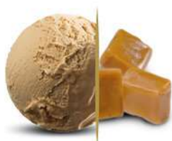
95737 CARAMELLO € 5 lt