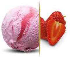
78309 FRAGOLA € 5 lt