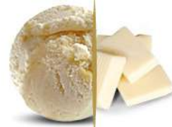
97509 CIOCCOLATO BIANCO