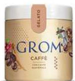
61865 CAFFÈ Con caffè del Guatemala