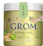
61867 PISTACCHIO Con pistacchio del Medio Oriente