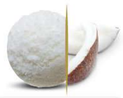
47782 COCCO € 2,4 lt