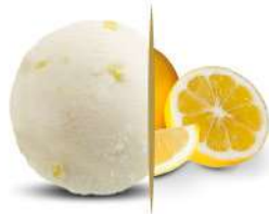
50114 LIMONE € 5,5 lt