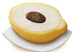
55657 GRAN LIMONE