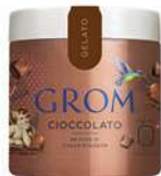
61857 CIOCCOLATO Da fave di cacao Ecuador