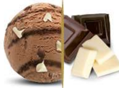
50104 TRIPLO CIOCCOLATO