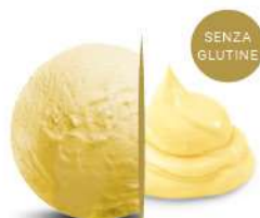
50111 CREMA ALL'UOVO