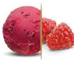
50122 SORBETTO ALLAMPONE