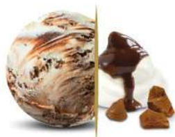
03253 SYTRACCIATELLA € 5 lt