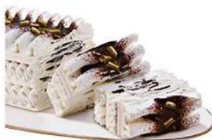
55818 VIENNETTA PANNA