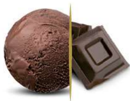
77056 DOUBLE CHOCOLATE € 5 lt