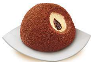
62840 TARTUFO CLASSICO