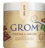
61859 CREMA DI GROM Con biscotti di Meliga e pezzetti di cioccolato