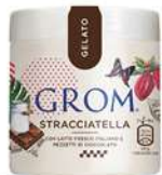
65103 STRACCIATELLA Con latte fresco italiano e pezzetti di cioccolato