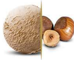
03245 NOCCIOLA € 5 lt