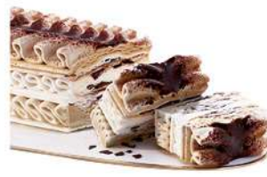
25035 VIENNETTA CAPPUCCINO