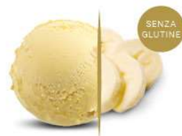
50117 BANANA € 5,5 lt