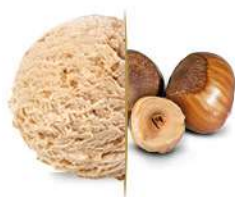
97694 PRALINÈ € 2,4 lt