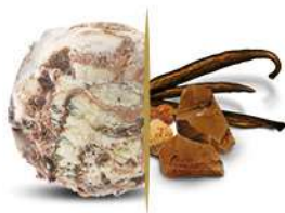
50102 VANIGLIA E COOKIES € 5,5 lt