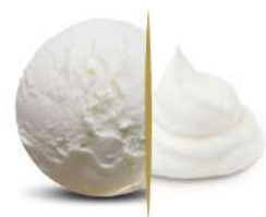
38100 GUSTO PANNA € 5 lt