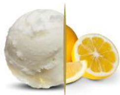
50116 SORBETTO AL LIMONE