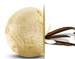
03220 VANIGLIA € 5 lt