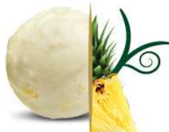
50125 SORBETTO ALL' ANANAS