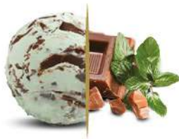
50120 MENTA E FOGLIE DI CACAO € 5,5 lt