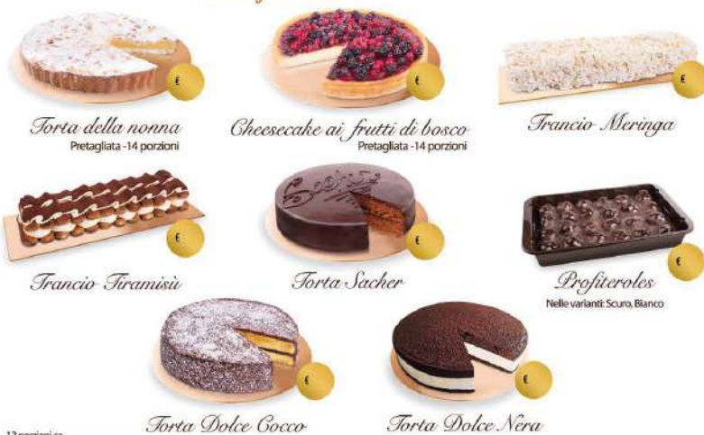
Torta della nonna Pretagliata - 14 porzioni