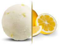
38660 LIMONE € 5 lt