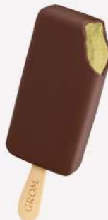
51054 STECCO PISTACCHIO 🍷 82 ml ▼ 16 pz