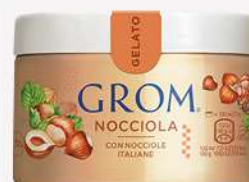
48897 NOCCIOLA Con nocciole italiane 🍷 120 ml □ 16 pz