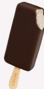
51057 STECCO FIOR DI PANNA 🍷 82 ml ▼ 16 pz