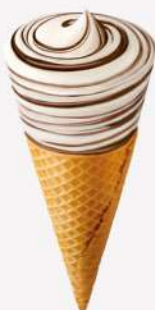
51049 CONO FIOR DI PANNA 🍷 120 ml ▼ 14 pz