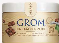
48691 CREMA DI GROM Biscotti di Meliga e pezzetti di cioccolato 🍷 120 ml □ 16 pz