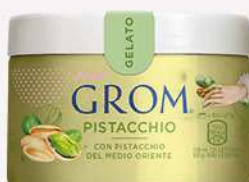
48674 PISTACCHIO Con pistacchio del Medio Oriente 🍷 120 ml □ 16 pz