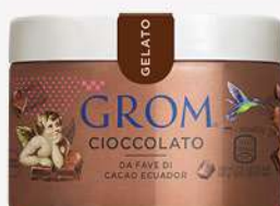
48681 CIOCCOLATO Con cacao dell'Ecuador 🍷 120 ml □ 16 pz