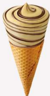
51064 CONO PISTACCHIO 🍷 120 ml ▼ 14 pz

Tutto ciò che siamo è per amore del gusto. Perché nutre i nostri sensi, perché meraviglia.