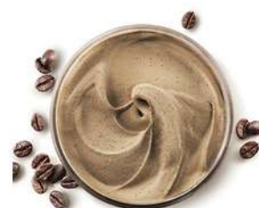
31771 CAFFÈ ESPRESSO