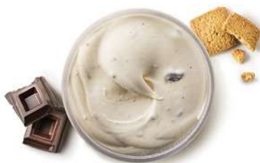
31752 CREAMA DI GROM