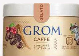
48693 CAFFÈ Con caffè del Guatemala 🍷 120 ml □ 16 pz