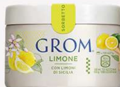
39584 LIMONE Con limoni di Sicilia 🍷 120 ml □ 16 pz